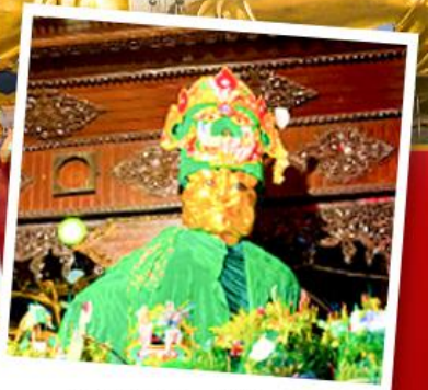
ขอพรแม่ย่ากษัตริย์