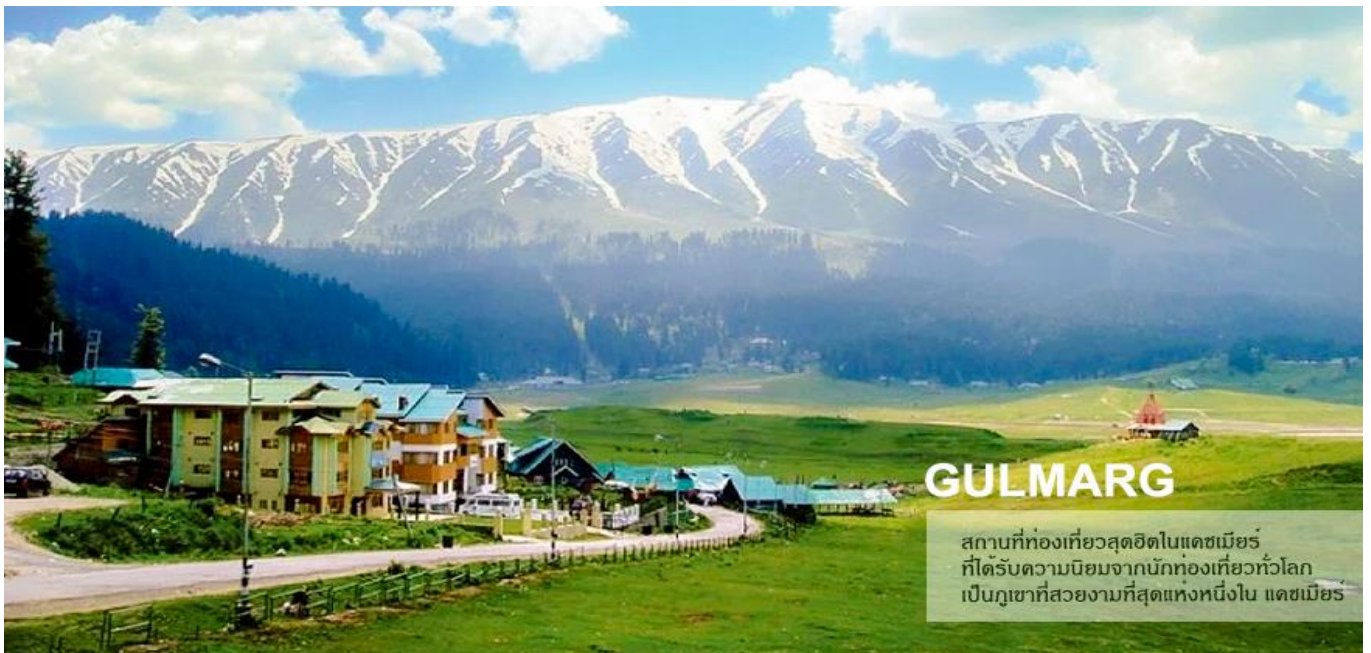
สถานที่ท่องเที่ยวสุดฮิตในแคชเมียร์ ที่ได้รับความนิยมจากนักท่องเที่ยวทั่วโลก เป็นภูเขาที่สวยงามที่สุดแห่งหนึ่งใน แคชเมียร์

นำท่านเดินทางไป กุลมาร์ค (Gulmarg) ใช้เวลาเดินทางประมาณ 3-4 ชั่วโมง "กุลมาร์ค" (GULMARG) หรือ "แดนทุ่งหญ้าของดอกไม้ (MEADOW OF GOLD)" "เป็นเทือกเขาอยู่สูงกว่าระดับน้ำทะเล 2,730 เมตร แต่เดิมมีชื่อเรียกว่า เการิมาร์ค ที่นี่ยังเป็นที่ตั้งของสนามกอล์ฟที่มีหลุมถึง 18 หลุมที่ยังสูงที่สุดในโลก "เทือกกุลมาร์ค" ได้รับการยอมรับจากผู้คนมากมายว่าเป็นสถานที่ที่มีทัศนียภาพที่สวยงามแห่งหนึ่งของโลก ที่สวยงาม