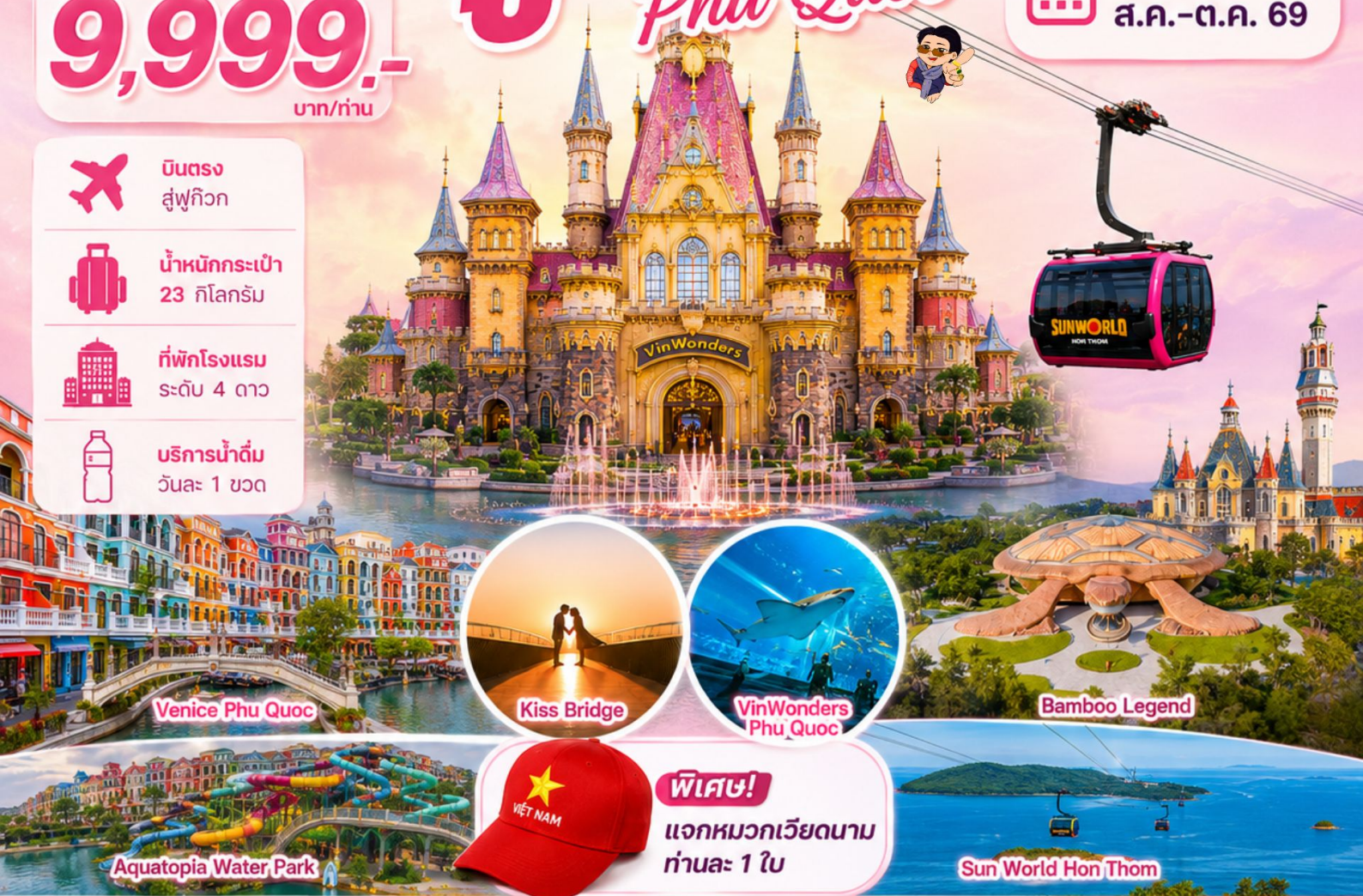
Venice Phu Quoc