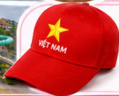
Aquatopia Water Park