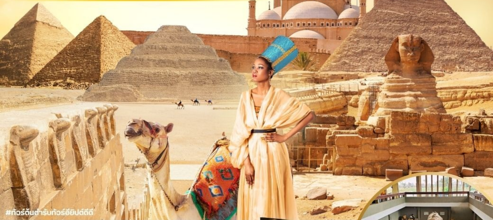
#ทัวร์ต้นตำรับทัวร์อียิปต์ดี