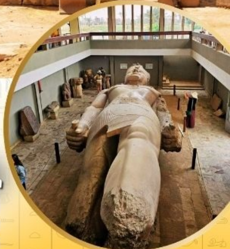
*เงื่อนไขเป็นไปตามบริษัททำหนดเท่านั้น*