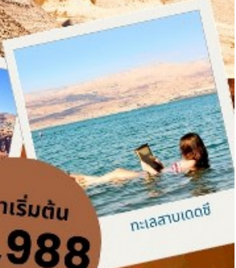
ทะเลสาบเดดซี