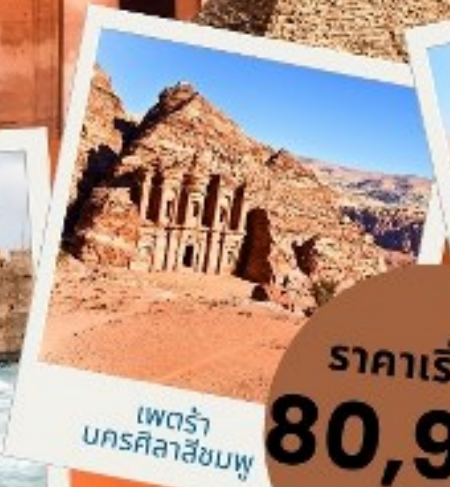
เพตรา นครศิลาสีชมพู