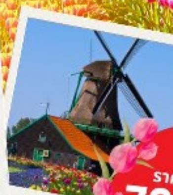
หมู่บ้านกังหันลม ซานส์ สคันส์