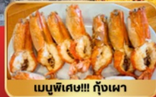
เมนูพิเศษ!!! กุ้งเผา