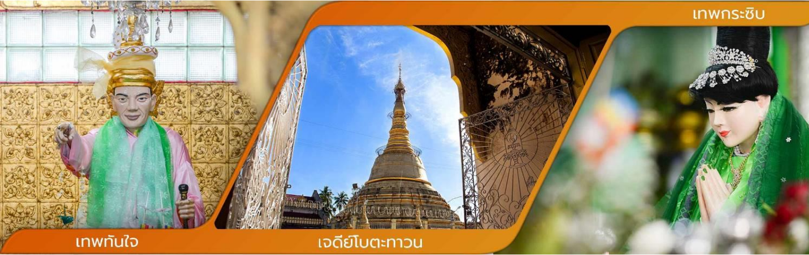
เทพทันใจ

คำบูชาเทพทันใจ เอหิ สักกะ มหานัทปิสะปิสะจีโปตะถ่องสิทธิมัตถุ อิทังพะลัง เอตัสสะมิงรัตตะนัง พุทธังธัมมัง สังฆัง เทวานัง ประสิทธิลาโภ ชโยนิจจัน วันทามิสัพพะทา สวาโหม