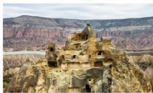
นครใต้ดิน