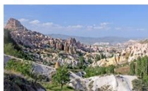
หมู่บ้านของนกพิราบ

** พักที่ DEDELI CAVE HOTEL 5* หรือเทียบเท่า **