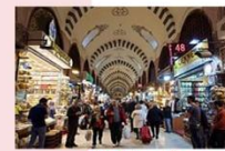
ตลาดสไปซ์มาร์เกต

** พักที่ TAKSIM GONEN HOTEL 4* หรือเทียบเท่า **