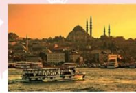
ถ่องเรือช่องแคบบอสฟอรัส