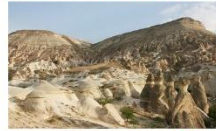
หุบเขาเคเฟเรนท