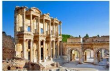
เมืองโบราณเอเฟซุส