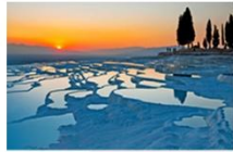
ปามุคคาเล่

** พักที่ RICHMOND THERMAL HOTEL 5* หรือเทียบเท่า **