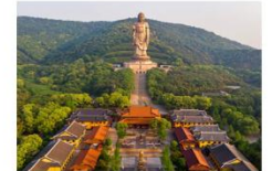
เทือกเขาเทียนชาน ร่องเรือทะเลสาบเทียนฉือ วัดพระใหญ่หรงกวงชาน

** พักที่ Mercure Wanda Hotel 4* หรือเทียบเท่า **