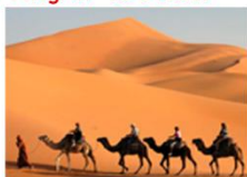
ซี่อูฐชมพระอาทิตย์ขึ้น

** พักที่ Karam Palace Hotel 4* หรือเทียบเท่า **