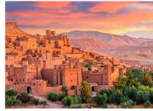
Ait Ben Haddou