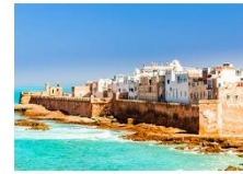
เมืองเอสซาอูอิรา

** พักที่ Adam Park Hotel 5* หรือเทียบเท่า **