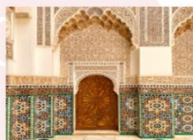
Ben Youssef Medersa