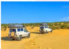
ทะเลทรายซาฮารา

** พักที่ Zahra luxury Desert Camp 4* หรือเทียบเท่า **