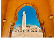
สุเหร่าแห่งกษัตริย์ฮัสซันที่ 2

06.10 น. เดินทางถึงสนามบินอิสตันบูล แวะเปลี่ยนเครื่อง 11.50 น. ออกเดินทางสู่สนามบินคาซาบลังกา เที่ยวบิน TK617 14.50 น. เดินทางถึงสนามบินคาซาบลังกา ประเทศโมร็อกโก