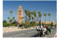
นั่งรถม้าชมเมือง

** พักที่ Adam Park Hotel 5* หรือเทียบเท่า **