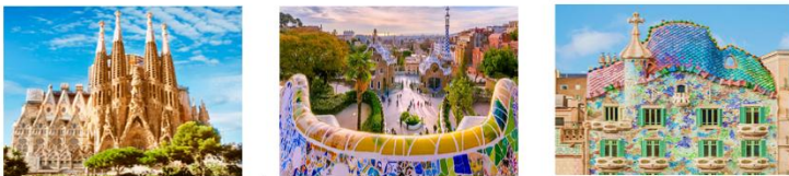
มหาวิหารซากราดา แฟมิลีย บาร์ค กูเอล คาซ่าบัตโล่

06.05 น. เดินทางถึงสนามบินอิสตันบูล แวะเปลี่ยนเครื่อง 09.10 น. ออกเดินทางสู่กรุงบาร์เซโลนา เที่ยวบิน TK1853 11.00 น. เดินทางถึงสนามบินกรุงบาร์เซโลนา ประเทศสเปน