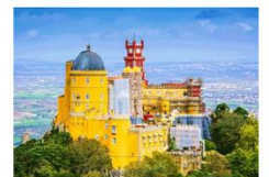
พระราชวังพินา

** พักที่ Mercure Lisbon Hotel 4* หรือเทียบเท่า **