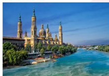
มหาวิหารซานตา มาเรีย เดอร์ฟิวลาร์

** พักที่ Eurostar Hotel 4* หรือเทียบเท่า **