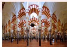
สุเหร่าเมซกิต้า

** พักที่ Eurostars Granada Hotel 4* หรือเทียบเท่า **