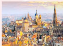
เมืองโทเลโด

** พักที่ Eurostars Toledo Hotel 4* หรือเทียบเท่า **