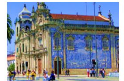
Sao Bento Train Station

** พักที่ Mercure Lisbon Hotel 4* หรือเทียบเท่า **