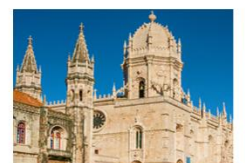
วิหารเจโรนิโมส

23.55 น. เดินทางถึงอิสตันบูล แวะเปลี่ยนเครื่อง