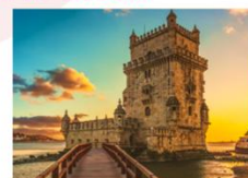
หอคอยบีเล็ม

16.00 น. ออกเดินทางสู่สนามบินอิสตันบูล เที่ยวบิน TK1760