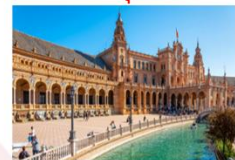
มหาวิหารเซบิยา

** พักที่ Mercure Lisbon Hotel 4* หรือเทียบเท่า **