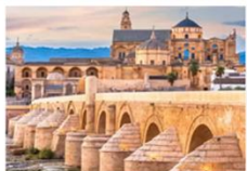
สะพานแบบโรมัน (ปูเอ็นเต้ โรมาน)

** พักที่ Eurostars Granada Hotel 4* หรือเทียบเท่า **