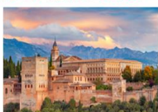
พระราชวังอัลฮามบรา

** พักที่ Hilton Garden Inn Sevilla Hotel 4* หรือเทียบเท่า **