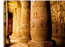
วิหารมาดินัตฮาบู

** พักที่ Royal Beau Rivage Nile cruise 5* หรือเทียบเท่า **