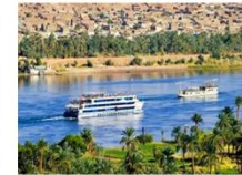
พักผ่อนตามอัธยาศัยบนเรือสำราญ

** พักที่ Royal Beau Rivage Nile cruise 5* หรือเทียบเท่า **