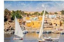
Option ล่องเรือเฟลกะ หรือ ล่องเรือชมหมู่บ้าน Nubian Village

** พักที่ Royal Beau Rivage Nile cruise 5* หรือเทียบเท่า **