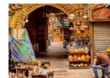
ตลาดชานเอลคาลีลี

20.50 น. ออกเดินทางสู่อิสตันบูล เที่ยวบิน TK695