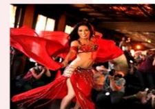
ชมระบำหน้าห้อง

** พักที่ Saray Pyramids & Museum View Hotel Hotel 4* หรือเทียบเท่า **