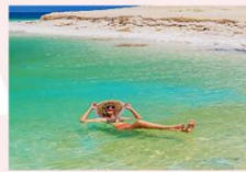
ทะเลเดดซี

** พักที่ Grand East Dead Sea Hotel 4* หรือเทียบเท่า **