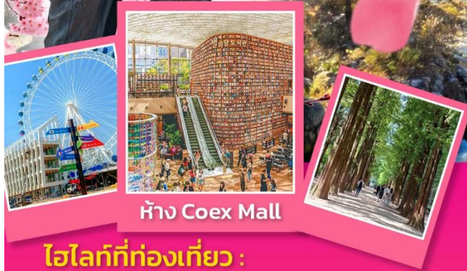
ห้าง Coex Mall

• เกาะนามิ • ชกโชอาย • ชอรัคซาน • กรุงโซล