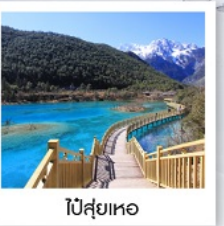
ไป๋สุ่ยเหอ

🚄 นั่งรถไฟความเร็วสูง จาก ลี่เจียง - คุณหมิง