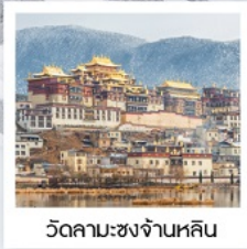
วัดลามะ: ชงจันหลิน