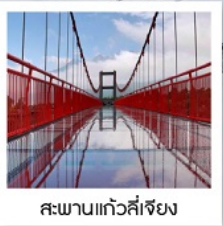
สะพานแก้วลี่เจียง