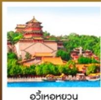
อวิ๋เหอหยวน