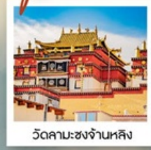
วัดลามะ:ซงจ่านหลิง