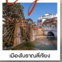
เมืองโบราณลี้เจียง