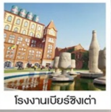
โรงแรมเบียร์ชิงเต่า