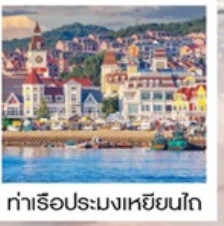
ท่าเรือประมงเขียนโก๋

เรือลิววิส / ย่านฮั่นเล่อฟาง / ถนนฮั่วจวิปา ท่าเรือประมงเขียนโก๋ / ย่านฮงโหว่ 1920 / ถนนโบราณเฉาหยาง หอคอยกาลเวลา / ชายหาดจินซา / รูปปั้นปลาวาฬ / หาดทรายซาจื่อโหว่ หาดไซเบอร์ NO.3 / โรงงานเบียร์ชิงเต่า / โบสถ์ St. Emil ถนนคนเดินไต้ตง / สะพานจันเฉียว / จัตุรัส 54 / ห้าง MIXC