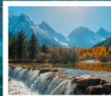
อุทยานπίงเิ่งโกว