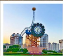
นาฬิกาตวรรษ