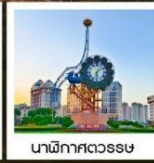
นาฬิกาตวรรษ