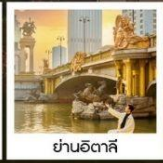
ย่านอิตาลี