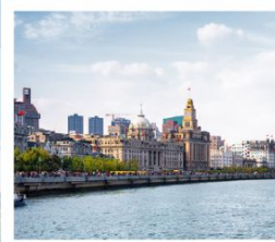
หาดว่อกาน