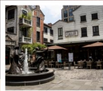
ซินเทียนตี้