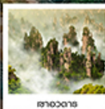
จางเจียเจีย