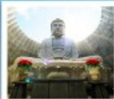
เนินพระพุทธรเจ้า