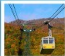
ภูเขาไฟอุสุ