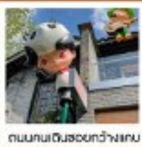
ถนนคนเดินฮอยกว้างเขม