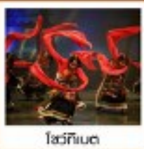
โซ่วทึนเต