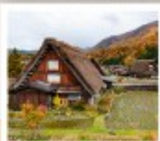
ชิราคาวาโกะ