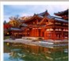
วัดเมียวโดอิน