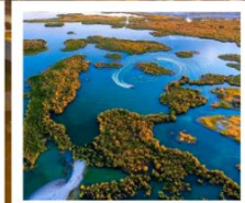
ทะเลสาบอูหลุนกู่

ผ่านทางด่วนทะเลทราย S21 / ทะเลสาบอูหลุนกู่ / ปู่อ๋อจิน / เซาโปซา / ทุ่งหญ้าอาเหอถังโก่ตี้ / หมู่บ้านเหมอู่ซุน / คานาสีอ / ทะเลสาบมังกรหลับ / ทะเลสาบเทวดา จุดชมวิวกานาสีอ / ศาลาชมปลา / ค่องเรือทะเลสาบคานาสีอ / หาดห้าสี / เมืองปีศาจ / เมืองคาลามาอี / คาลามาอี / แกรนด์แคนยอนตูซันจือ / ตลาดต้าปาจาง