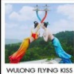
WULONG FLYING KISS