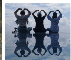
เขาหลิงซาน