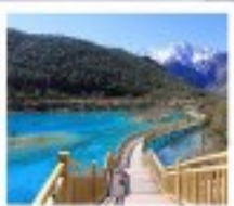
โป๋ซู่เหอ