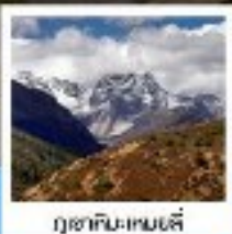
ภูเขาหิมะหม่าป๋อ