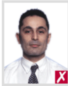
ไกลเกินไป