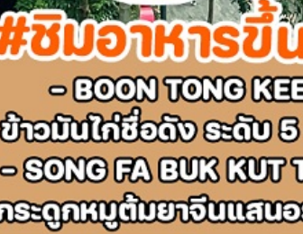
#ชิมอาหารขึ้นชื่อ - BOON TONG KEE ข้าวมันไก่ชื่อดัง ระดับ 5 ดาว - SONG FA BUK KUT TEH กระดูกหมูต้มยาจีนแสนอร่อย