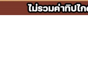
#บิณฑังงานดูแล พาบูเตล - Garden by the bay - Merlion - Clarke Quay - Fort canning park - Marina bay sands - Jewel

#บินเข้า กลับดีก เลือก Option Freeday / Fullboard