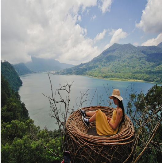
WanagiriHidden Hills Baliสำหรับกิจกรรมการถ่ายภาพ

จากนั้นนำท่านเดินทางสู่ Wanagiri Hidden hill ตั้งอยู่บนทางหลวง Munduk Wanagiri ที่มีความสูงของพื้นที่ภูเขาทางตอนเหนือของเกาะบาหลี เนินเขา และทะเลสาบที่มีความสวยงามเป็นเอกลักษณ์ แหล่งท่องเที่ยวทางธรรมชาติของ ถือเป็นกิจกรรมน่าสนใจที่ซ่อนอยู่ในบาหลี หนึ่งในนั้นคือการท่องเที่ยวทางธรรมชาติที่น่าทึ่งพร้อมเสน่ห์แห่งความงามที่เหมาะสมสำหรับการพักผ่อนและเซลฟีใน Buleleng Wanagiri Hidden Hills Bali นำเสนอจุดถ่ายรูปที่มีคอนเซ็ปต์มีเสน่ห์ของ