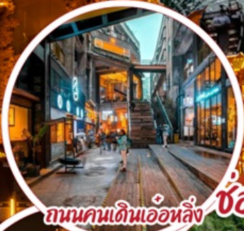
ถนนคนเดินเอ๋อหลิ่ง