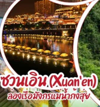
ชว่นเอน (Xuan'en) ล่องเรือมังกรแม่น้ำหงส์