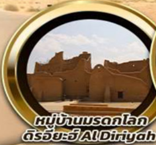
หมู่บ้านมรดกโลก ดิรัยยะฮ์ AlDiriyah

บินหรู อยู่สบาย เทียบชิด ชิลด์ 10 ท่าน คอนเฟิร์มเดินทาง