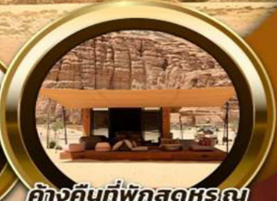
ค้ำคืนที่พักสุดหรู ณ Habitat AlUla 2 คืน

📍 พิเศษ!! รับประทานอาหาร ณ ภัตตาคารอาหารไทย สุดหรูและไฮโซ @Saffron Banyan Tree AlUla