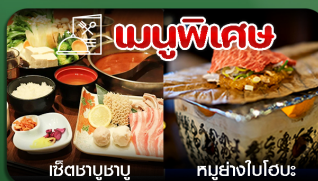
เซตซาบูซาบู คุปย่างไปโอะ

ไอซาก้า-ฮาคุบะ-คาเฟ่city bakery-นั่งกระเช้าชมวิว-ปราสาทโทยาม่า-ชมงานประดับไฟ-ชิราคาวะโกะ-ซ้อมปิ้งชินไซบาชิ-เที่ยวเต็มไม่มีอิสระ