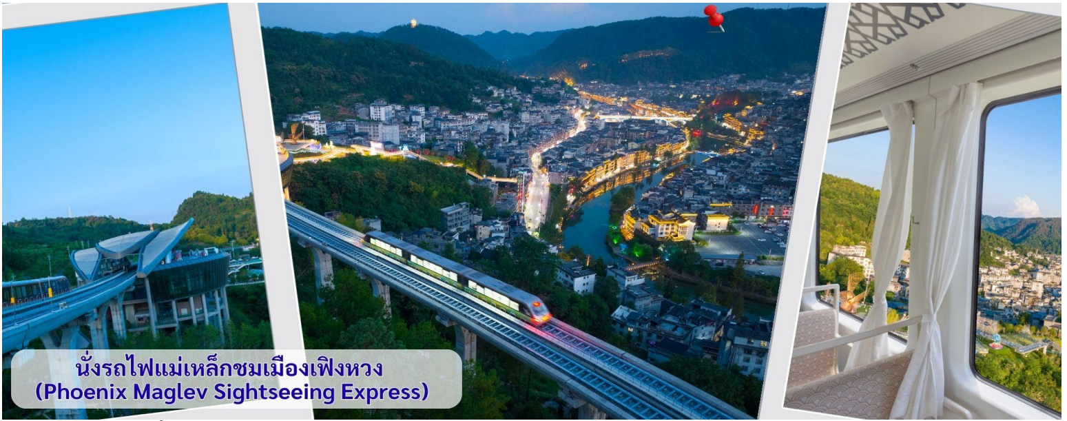
นั่งรถไฟแม่เหล็กชมเมืองเฟิงหวาง (Phoenix Maglev Sightseeing Express)

จากนั้นนำทุกท่าน เดินถนนโบราณ Feng Hueng Ancient Town ที่ถนนช้อปปิ้ง Shibanshi Street เมืองที่ยังคงรักษาเอกลักษณ์ความเป็นพื้นเมืองผสมผสานกับยุคปัจจุบันเอาไว้ได้อย่างลงตัววิถีชีวิตของชาวบ้านที่อาศัยอยู่ที่นี้ บรรยากาศใน เมืองเฟิงหวาง ถนนเก่าช้อปปิ้งเป็นถนนปูหินแคบๆ กว้างไม่ถึง 5 เมตร ทอดยาวจากทางเข้าวัดเต้าเหมินไปทางทิศตะวันตก ผ่านถนนหลายสาย ได้แก่ ถนนครอส ถนนเจิ้งตวันออก ถนนเจิ้งตวันตก ศาลาฮุยหลง หียงเซียวซง เต้าซานลา ศาลา เจี้ยกั๋ว และสุสานเซินฉงเหวิน สุดท้ายจะนำไปสู่ “น้ำพุแรกใต้ฟ้า” ถนนสายนี้มีความยาวกว่า 3,000 เมตร และเป็นย่าน การค้าที่คึกคักที่สุดในเฟิงหวาง