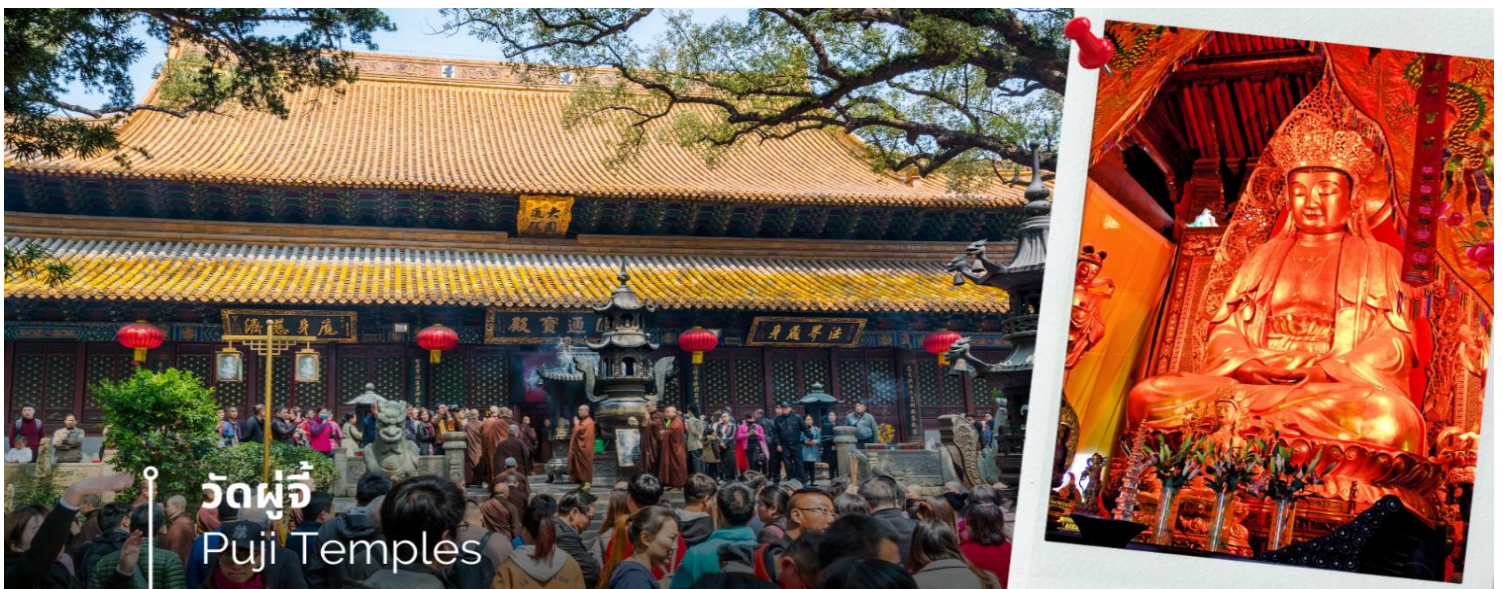
วัดผู้จี Puji Temples

หลังจากนั้นนำท่านนมัสการองค์พระโพธิสัตว์ เจ้าแม่กวนอิมไม่ยอมไป วัดไผ่สีม่วง อีกหนึ่งวัดที่ตั้งอยู่บนเกาะผู้โถวซาน ซึ่งที่นี่ได้รับสมญานามว่า “เกาะพระโพธิสัตว์” เพราะเป็นวัดเล็กๆ ที่อยู่ติดกับทะเล สาเหตุที่เรียกว่าวัดไผ่ม่วงเพราะว่าบริเวณนั้นมีต้นไผ่สีม่วงขึ้นเยอะ และความพิเศษอีกอย่างหนึ่งคือ ต้นไผ่สีม่วงจะมีในเกาะแห่งนี้ที่เดียว สำหรับไฮไลท์เด็ดของที่นี่คือ “เจ้าแม่กวนอิมไม่ยอมไป” ซึ่งวัดนี้มีประวัติมาอย่างยาวนาน ตั้งแต่สมัยราชวงศ์ถัง (ค.ศ. 961) ซึ่งเป็นยุคที่พุทธศาสนามีความเจริญรุ่งเรืองในแผ่นดินจีน พระโพธิสัตว์ศักดิ์สิทธิ์องค์นี้ไม่ยอมรับอัญเชิญไปประดิษฐานที่ญี่ปุ่นตามการอัญเชิญของหลวงพ่อู่ฮุยเอ้อ ภิกษุชาวญี่ปุ่นที่มาศึกษาพระธรรม องค์ท่านจึงได้ดลบันดาลให้เกิดพายุฝนจนไม่