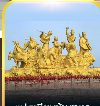
แปดเซียนข้ามทะเล