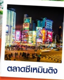
ตลาดซีเหมินติง