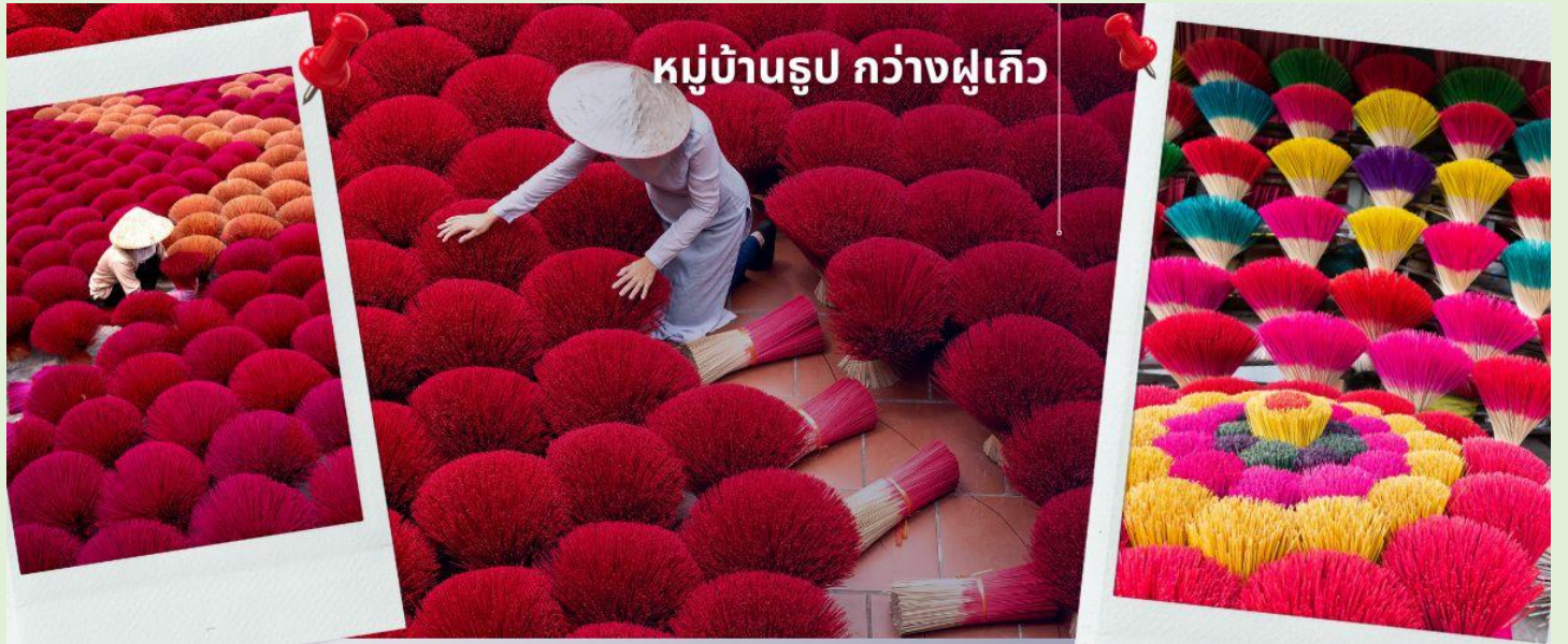
หมู่บ้านรูป กว้างฝูเกิว

จากนั้นนำท่านเดินทางสู่เมืองนิงห์บิงก์ และเที่ยวชมวิถีของชาวเวียดนามใน หมู่บ้านรูป หมู่บ้านชุมชนที่เป็นแหล่งผลิตรูปที่ใหญ่ที่สุดแห่งหนึ่งของประเทศเวียดนาม หมู่บ้านกว้างฝูเกิว หมู่บ้านรูป เอกลักษณะเหมือนทุ่งดอกไม้ใกล้กรุงซานอย ชาวบ้านที่ส่งต่อ และถ่ายทอดวิธีการทำรูปแบบดั้งเดิม ทั้งการเหลาไม้ไผ่ ย้อมสี ตากแดด และมัดลักษณะคล้ายพุ่มไม้ หรือ ดอกไม้ เอกลักษณะนี้ถูกพัฒนาและต่อยอด จัดแต่งรูปให้เป็นคล้ายสวน ดึงดูดนักท่องเที่ยวให้ไปเยี่ยมชม เรียกได้ว่า เป็นแลนมาร์คใหม่ของนักท่องเที่ยวเลยทีเดียว