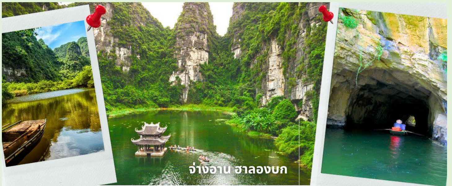
จ่างอาน ฮาลองบก

จากนั้นนำท่านเดินทางสู่ จ่างอาน เป็นพื้นที่ที่มีทัศนียภาพอันงดงามของยอดเขาหินปูน แม่น้ำหลายสายไหลลัดเลาะ บางส่วนจมอยู่ใต้น้ำ และยังคงล้อมรอบด้วยผาสูงชัน จึงทำให้สถานที่แห่งหนึ่งงดงามน่าชม การชื่นชมทัศนียภาพที่สวยงามในจ่างอานนั้น คือการล่องเรือเล็กประมาณลำละ 4-5 คนเพื่อเข้าไปเยี่ยมชมจ่างอาน เรือแจวก็จะพาเราไปเยี่ยมชมวัด หลังจากนั้นก็จะพาเราไปลอดถ้ำ มีทั้งหมด 49 ถ้ำ ซึ่งแต่ละถ้ำจะมีชื่อแตกต่างกันไปจะใช้เวลาล่องเรือไปกลับร่วมสองชั่วโมงเลย ทีเดีย จ่างอานยังถูกเรียกว่า ฮาลองบก เพราะที่นี่มีเขาหินปูนและถ้ำคล้ายกับที่อ่าวฮาลอง