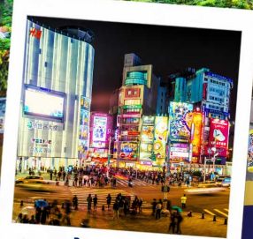
ช้อปปิ้งซีเหมินติง