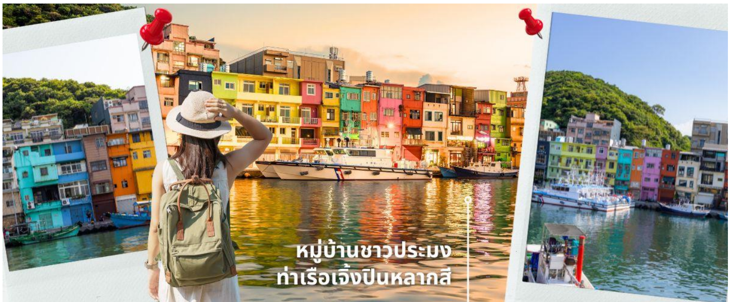
หมู่บ้านชาวประมง ท่าเรือเจิ้งปินหลากสี

นำท่านถ่ายรูปสุดชิคที่ ท่าเรือเจิ้งปิน เมืองจีหลง อีกหนึ่งสถานที่ท่องเที่ยวยอดฮิตของเมืองจีหลง (Keelung) ในตอนนี้ น่าจะหนีไม่พ้น ท่าเรือประมงเจิ้งปินเป็นท่าเรือที่ใหญ่ที่สุดในไต้หวัน ทำให้ในยุคแรกๆ ท่าเรือจีหลงเจริญรุ่งเรืองเป็นอย่างมาก สำหรับที่นี่ สวย น่าเที่ยวมากๆ ต้องมาให้ได้ เพราะนอกจากจะมีบ้านหลากสีที่ตั้งอยู่ริมน้ำแล้ว ยังมีคาเฟ่เก๋ๆ มีร้านอาหาร อีกเพียบ