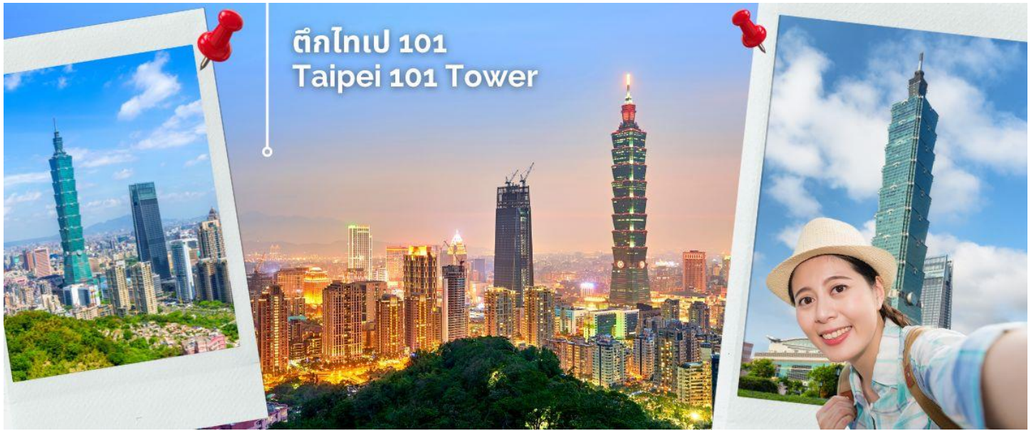
ตึกไทเป 101 Taipei 101 Tower

(REVISED) CVZT5 ไต้หวัน สายมู ขอคู่วัดเสี่ยวไห่เจิ้งหวง ชมทะเลสาบ 4 วัน 3 คืน VZ (AUG-SEP24)