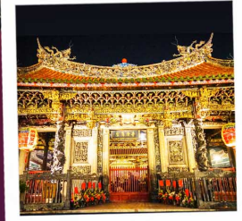
วัดหลงซาน