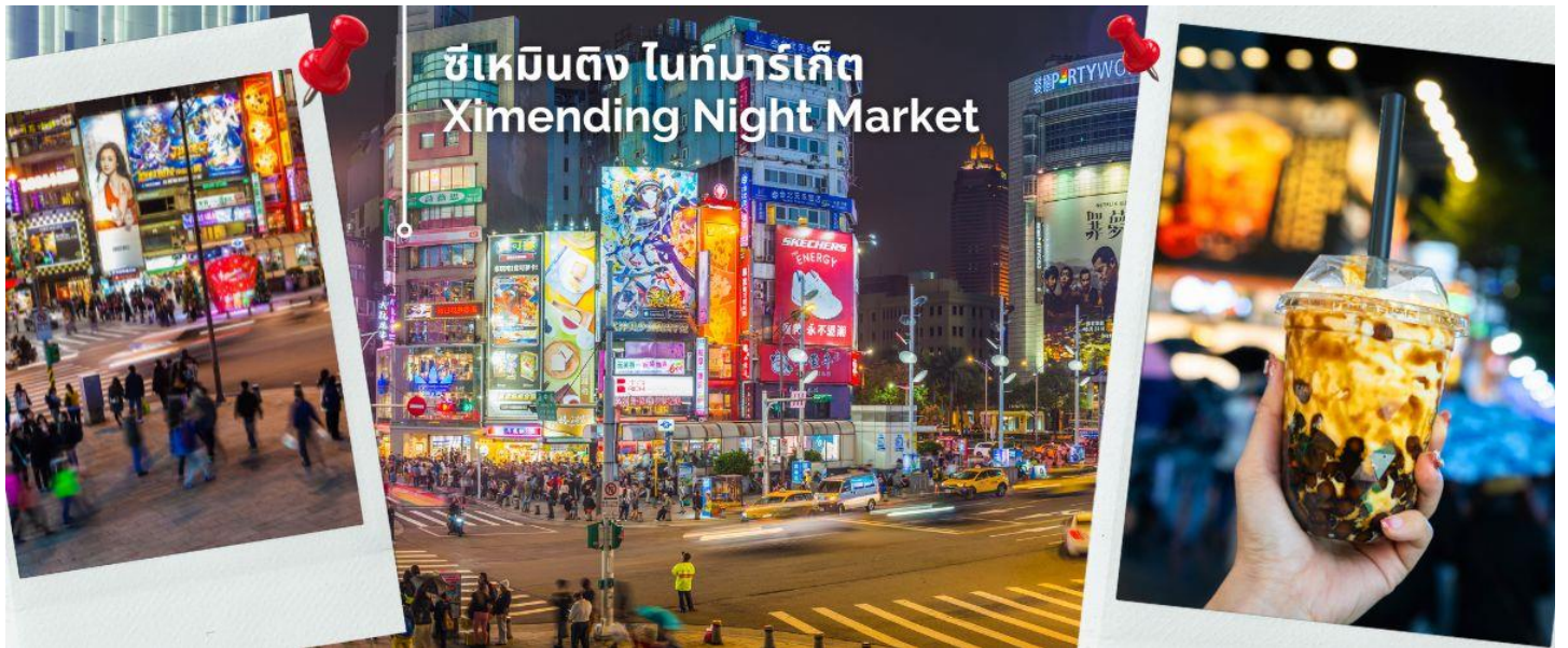
ซีเหมินติง ไนท์มาร์เก็ต Ximending Night Market

นำท่าน ช้อปปิ้งซีเหมินติง ไนท์มาร์เก็ต หรือที่คนไทยรู้จักกันในนาม สยามสแควร์แห่งไทเปเป็นย่านช้อปปิ้งของวัยรุ่นและวัยทำงานของไต้หวัน ไนยานนี้เป็นถนนคนเดินโดยแบ่งโซนเป็นสีต่างๆ เช่น แดง เขียว น้ำเงิน โดยสังเกตจากเสาข้างทางจะมีการระบุหมายเลขและทาสีไว้อย่างเป็นระเบียบ ร้านค้าแนะนำสำหรับนักท่องเที่ยวชาวไทย ซึ่งราคาถูกกว่าไทยประมาณ 30 % ได้แก่ ONITSUKA TIGER , NEW BALANCE , ADIDAS , H&M , MUJI ซึ่งรวมสินค้ารุ่นหายากและราคาถูกมากๆ