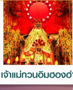
เจ้าแม่กวนอิมฮ่องกง