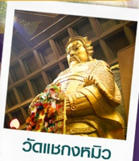
วัดเขาถกหมิว