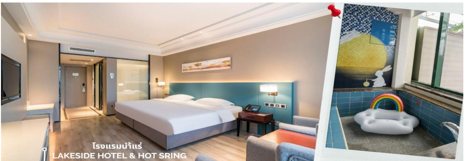
โรงแรมน้ำแร่ LAKESIDE HOTEL & HOT SRING

🏠 นำท่านเข้าสู่ที่พัก LAKESIDE HOTEL & HOT SRING 5 ดาว หรือเทียบเท่า