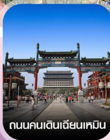
ถนนคนเดินเฉียนเหมิน

✈️ คอนเฟิร์มออกเดินทาง ทุกพีเรียด 2 ท่านขึ้นไป