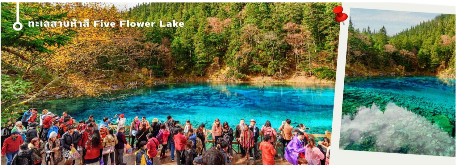
ทะเลสาบห้าสี Five Flower Lake

ทะเลสาบที่ใหญ่ที่สุด สูงที่สุด และลึกที่สุดในจิวจ้ายโกว ด้วยเนื้อที่กว่า 581 ไร่ ความยาวกว่า 7 กิโลเมตร และลึกถึง 103 เมตร ทอดตัวโค้งเป็นรูปพระจันทร์เสี้ยว เนื่องจากหิมะบนภูเขาละลายลงมา น้ำในทะเลสาบสีฟ้าสวยงาม ล้อมรอบด้วยยอดเขาสูงชัน และต้นไม้ใหญ่ที่ปกคลุมด้วยหิมะ งดงามราวหลุดออกมาจากภาพวาด ความพิเศษในช่วงฤดูหนาว ทะเลสาบจะกลายเป็นน้ำแข็งหนากว่า 60 ซม. ทำให้นักท่องเที่ยวนิยมมาเล่นสเก็ตน้ำแข็งกันเป็นจำนวนมาก