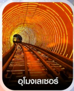
อุโมงเลเซอร์

✈️ คอนเฟิร์ม ออกเดินทาง ทุกพีเรียด 2 ท่านขึ้นไป