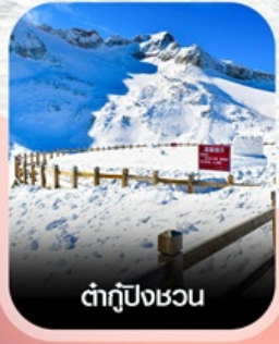
ต้ากู่ปิงชอน

✈️ คอนเฟิร์มออกเดินทาง ทุกพีเรียด 2 ท่านขึ้นไป