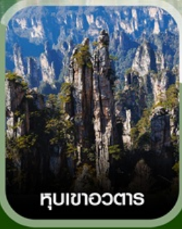
หุบเขาอวตาร

ฟรี ใส่ชุดชนเผ่าท้องถิ่น บัตรตรงลงจางเจียเจีย